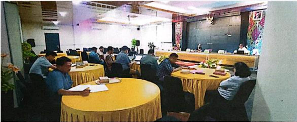
Lampiran 1. Pelaksanaan Kegiatan RTM & RTL PPs Undana 2023